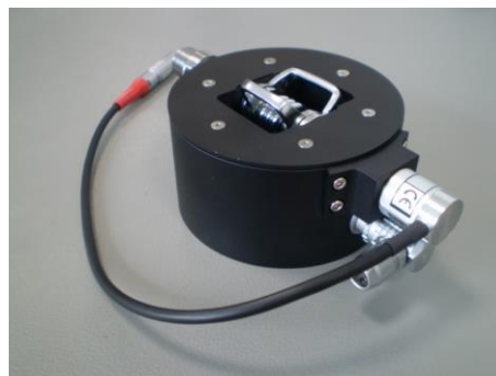
Pédale avec codeur de position